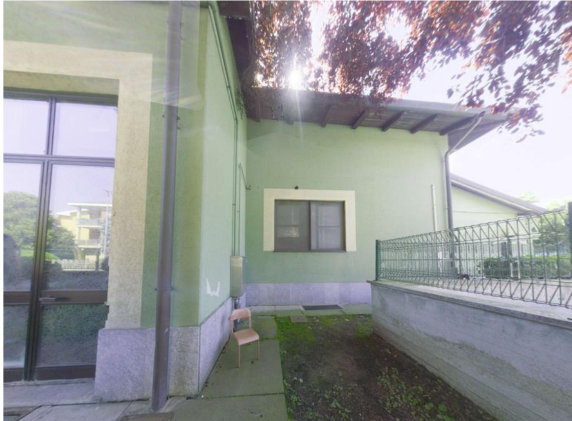
13. Prospetto nord-ovest