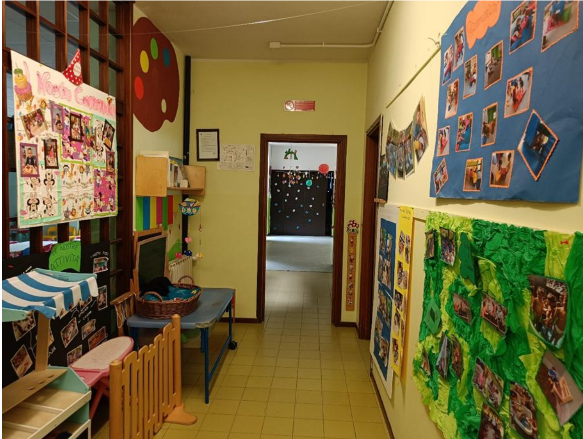
19. Corridoio per accesso soggiorno divezzi e sulla destra soggiorno lattanti