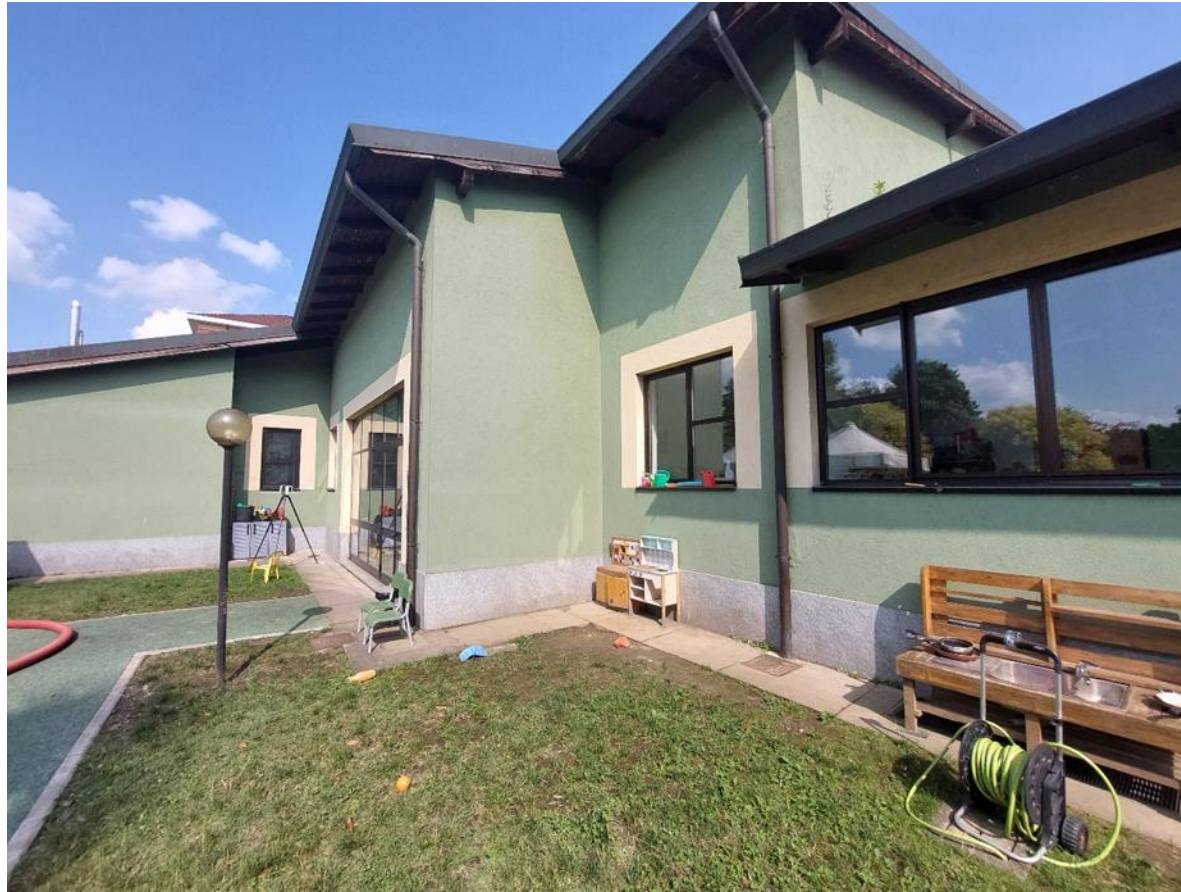
7. Prospetto nord-est