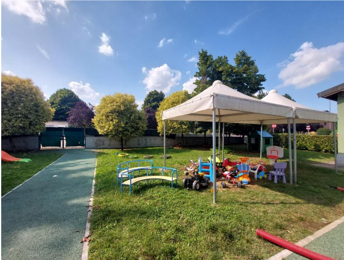
9. Giardino interno lato nord-est