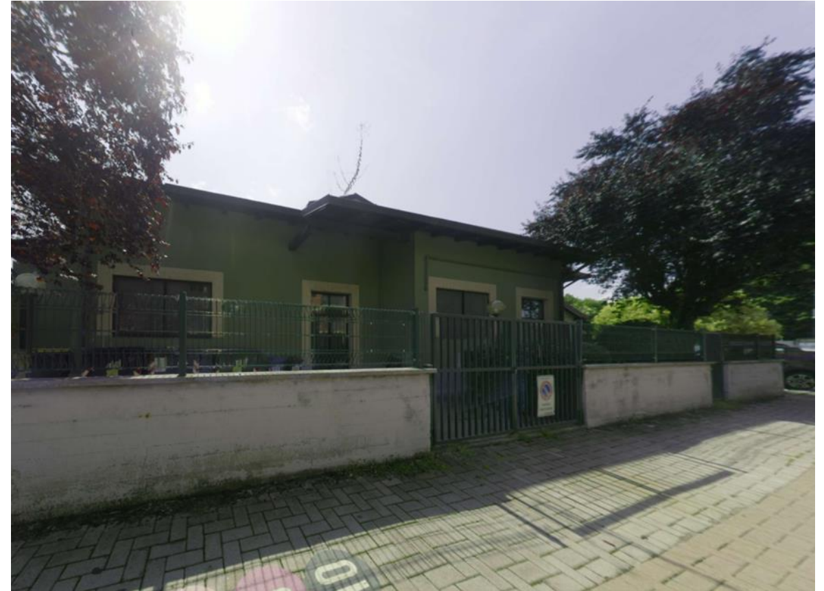
14. Prospetto nord-ovest lato Via Morandi