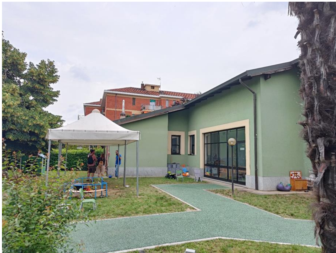
5. Prospetto nord-est