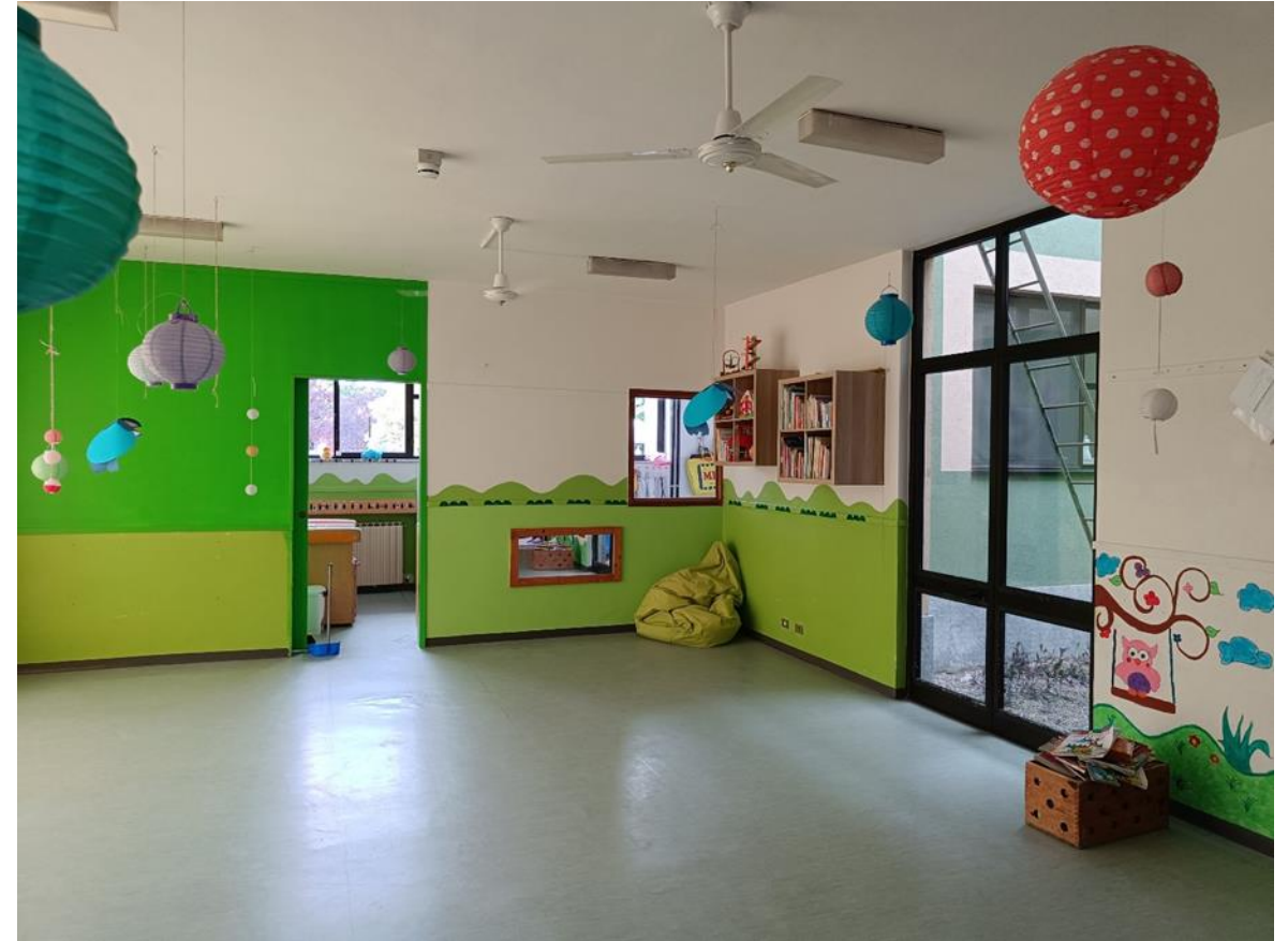
20. Soggiorno divezzi