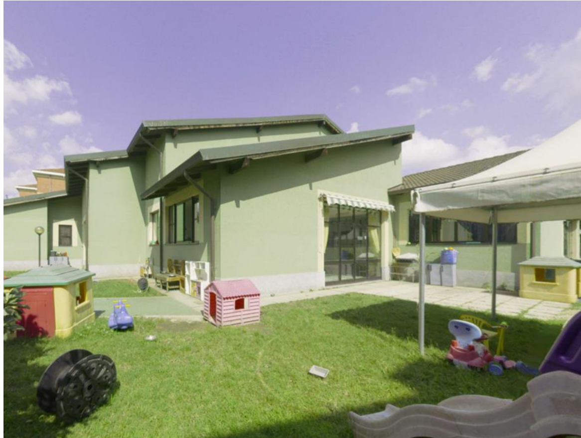
11. Prospetto sud-est