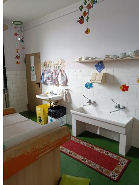
26-27. Servizi igienici lattanti