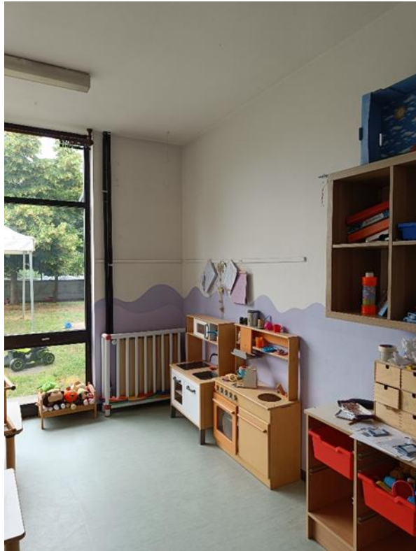
24. Soggiorno lattanti