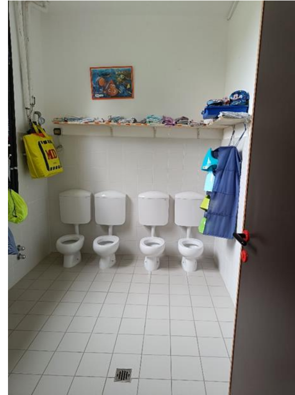
22-23. Servizi igienici divezzi