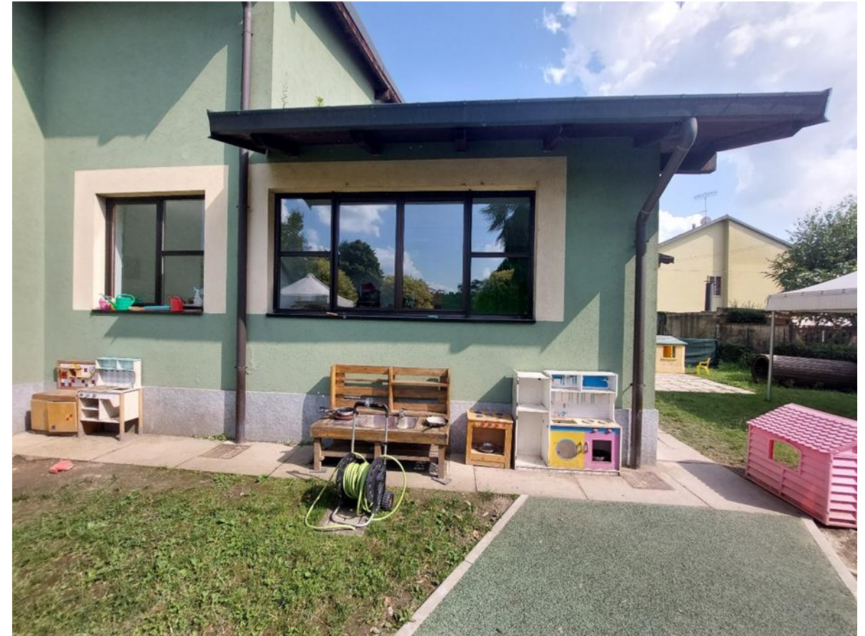
8. Prospetto nord-est