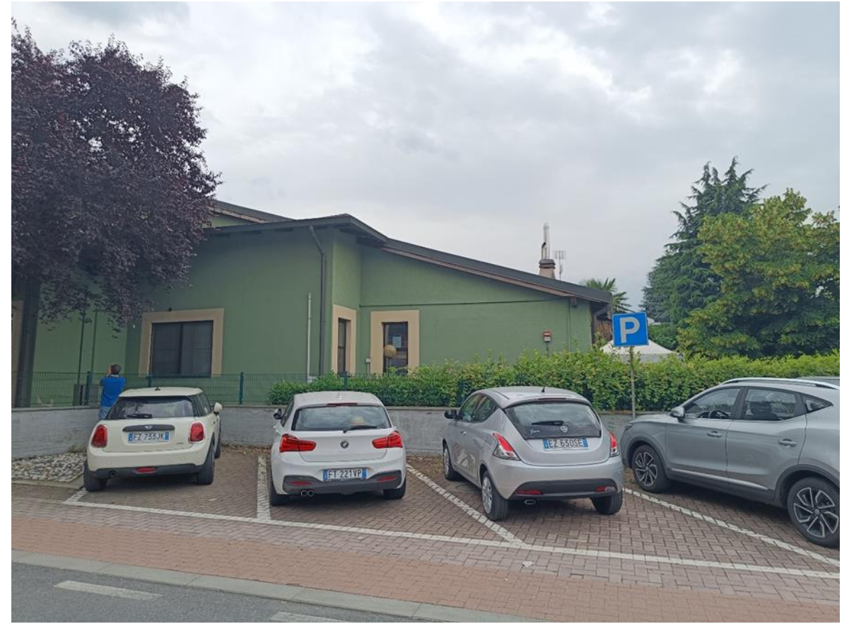
2. Prospetto nord-ovest lato Via Morandi