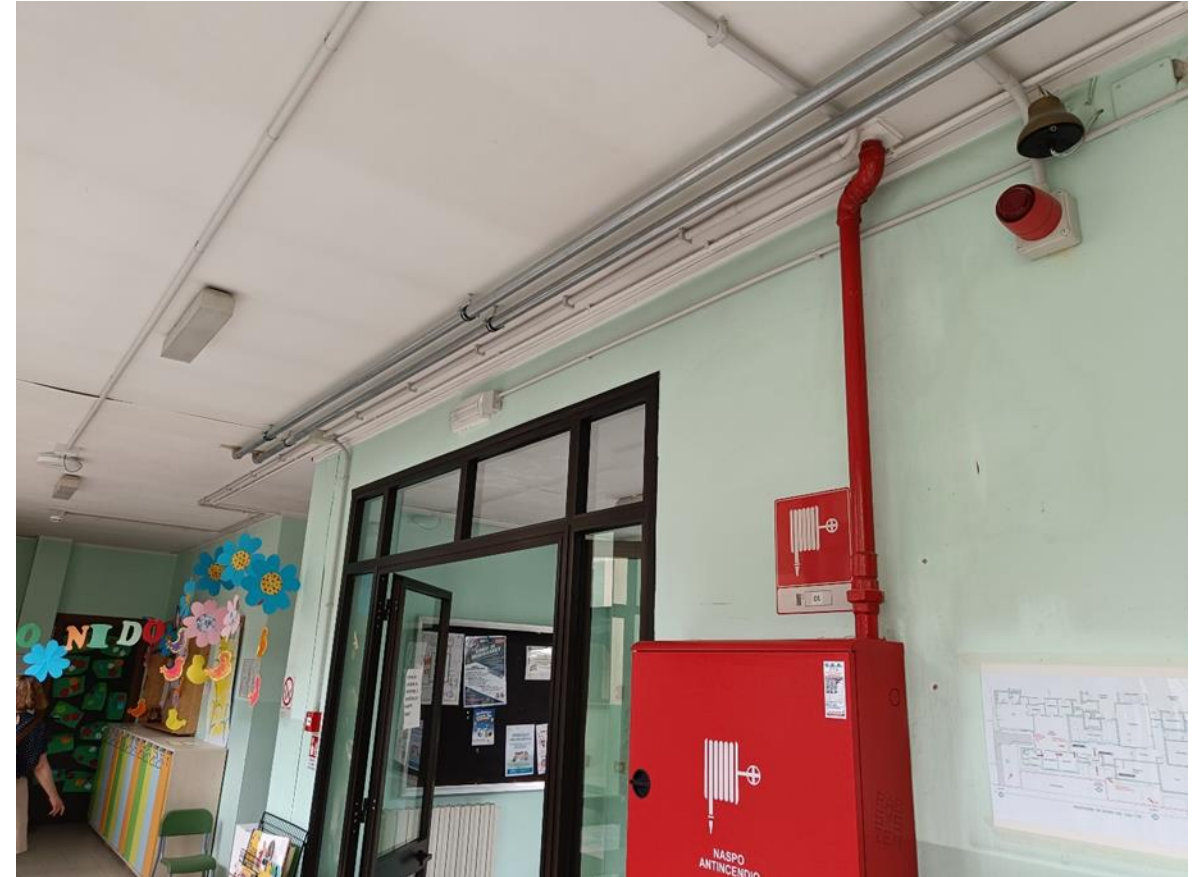
16. Ingresso principale