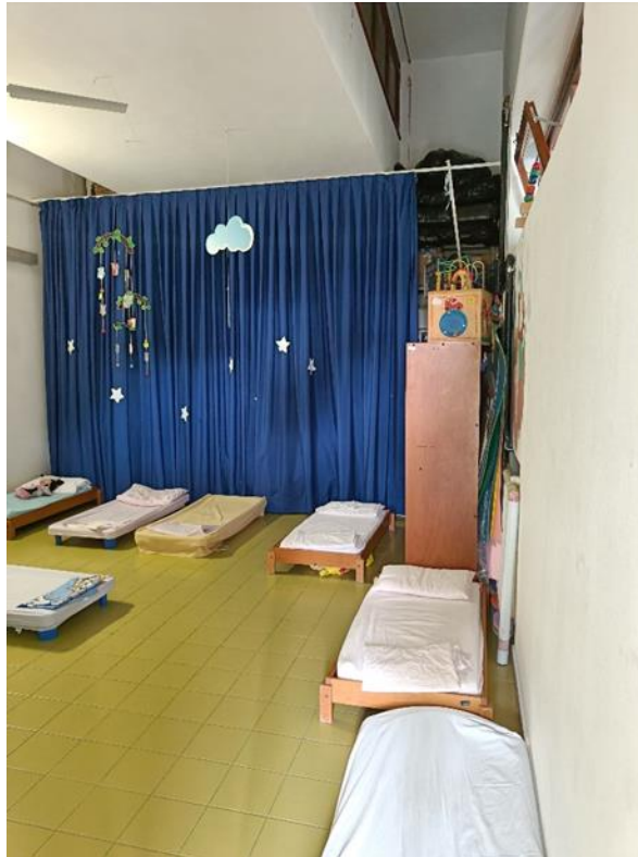
25. Aula riposo lattanti