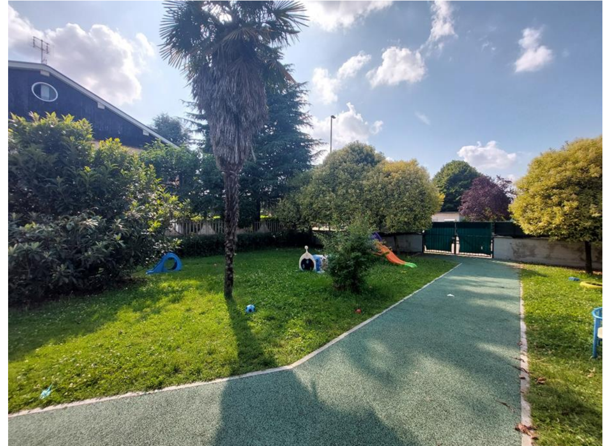
10. Giardino interno lato nord-est