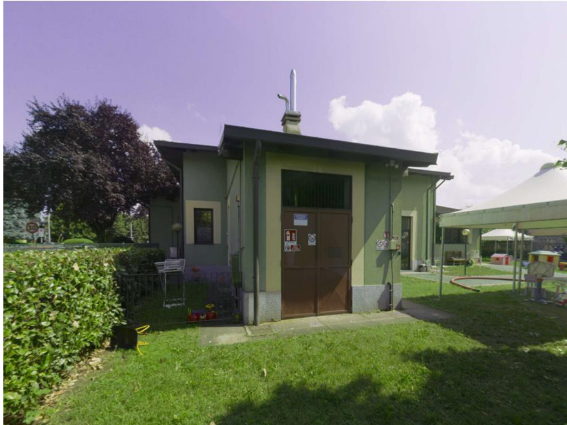
3. Prospetto nord-est