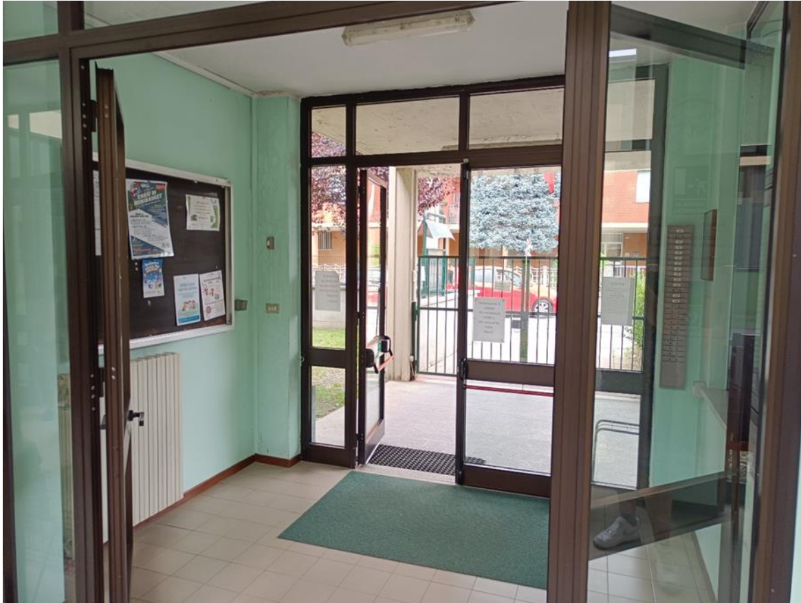
15. Ingresso principale lato Via Morandi