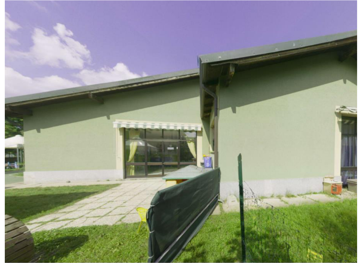
12. Prospetto sud-est