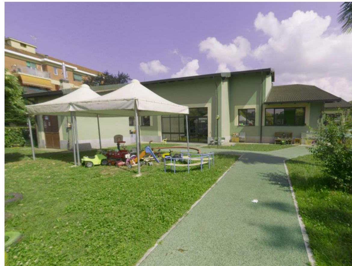
6. Prospetto nord-est