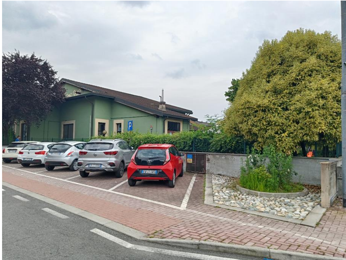
1. Prospetto nord-ovest lato Via Morandi