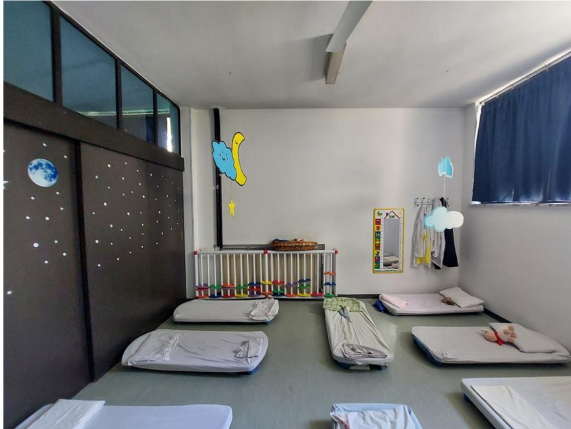
21. Aula riposo divezzi