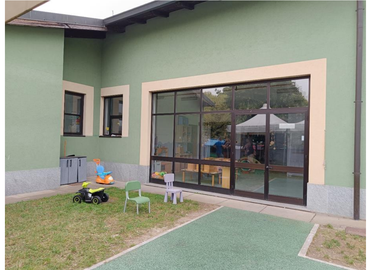
4. Prospetto nord-est